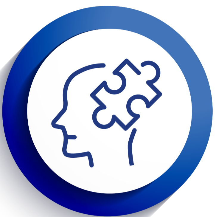
PAS Programa de Apoyo Socioafectivo al Estudiante