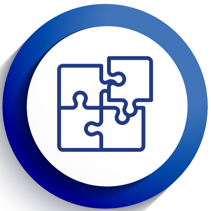
EQUIPO DAE REGIONES